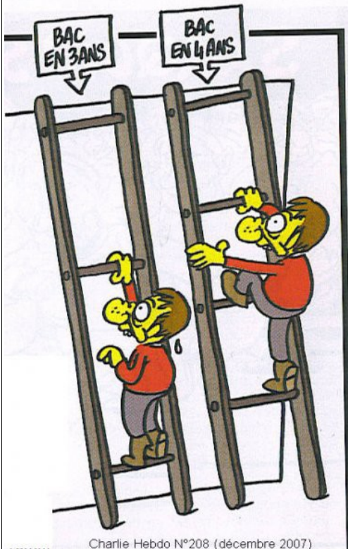
Charlie Hebdo N°208 (décembre 2007)

Ce stage est ouvert à tous les collègues, syndiqués et non-syndiqués. N'hésitez pas à y inviter vos collègues intéressés.